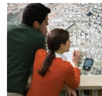
Mapas y ortofotografías