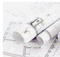
Dibujos CAD (color y blanco y negro)

Puede usar la impresora de producción HP DesignJet T7200 para imprimir cualquier combinación de aplicaciones en una amplia gama de sustratos, desde papel bond a papel fotográfico brillante, para obtener la máxima versatilidad, incluyendo: