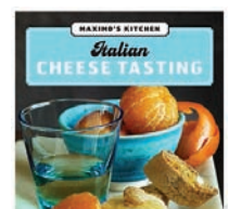
Cartelería en la tienda