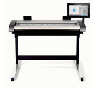
Escáner HP DesignJet HD Pro