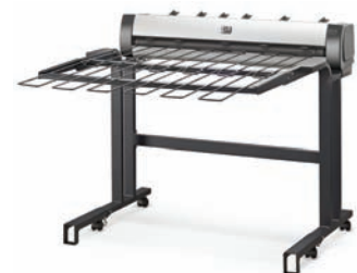
Apilador HP DesignJet