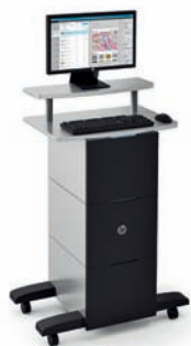
Software HP SmartStream