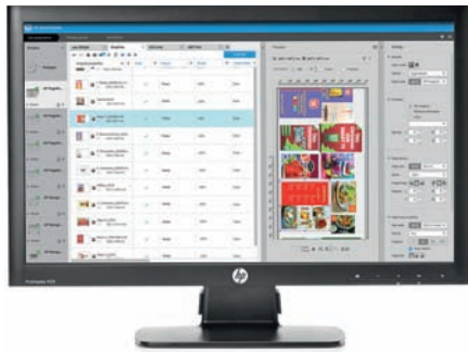
Software HP SmartStream

Una impresora de alta velocidad con bajo costo de propiedad que aumenta la productividad y crea impresiones de alta calidad en diversos sustratos. El software HP SmartStream ofrece una correcta administración de PDF y vistas previas de impresión reales a través de la tecnología HP Crystal Preview.