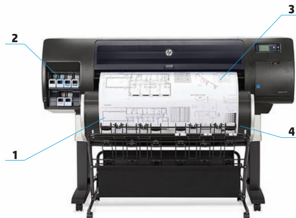
Impresora de producción HP DesignJet T7200