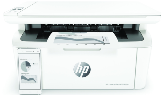
Multifunções HP LaserJet Pro M28w

Impressora com segurança dinâmica ativada. Destina-se apenas a ser utilizada com consumíveis que utilizam um chip HP original. Os consumíveis com um chip de outra marca poderão não funcionar e aqueles que funcionam atualmente poderão não funcionar no futuro. Saiba mais em: http://www.hp.com/go/learnaboutsupplies