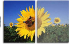
With SmartImage Without SmartImage

SmartImage, ekranınızda görüntülenen içeriği analiz ederek size en iyi ekran performansını sunan benzersiz ve öncü bir Philips teknolojisidir. Kullanıcı dostu bu arayüz İş, Fotoğraf, Film, Oyun, Ekonomi gibi çeşitli modlar arasından uygulamaya en uygun olanı seçmenizi sağlar. Yaptığınız seçime bağlı olarak SmartImage; kontrastı, renk doygunluğunu, fotoğraf ve videoların netliğini dinamik olarak optimum hale getirerek mükemmel bir ekran performansı sunar. Ekonomi modu önemli ölçüde enerji tasarrufu sağlar. Tüm bunlar tek bir düğmeyle gerçek zamanlı olarak elinizin altında!